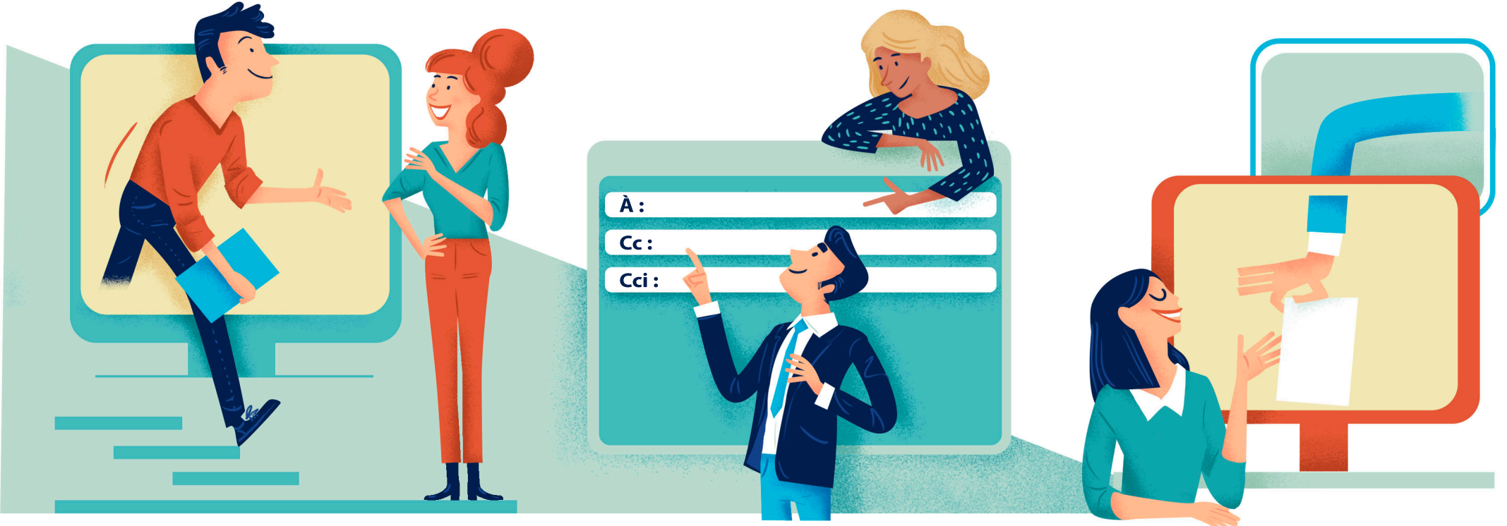
1 Évaluer la pertinence de l'utilisation de la messagerie électronique dans une situation donnée